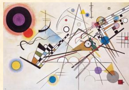
Compositie VIII uit 1923

De kunsthistoricus Herbert Read zou Kandinsky's werken van voor 1910 klasseren als fauvistische impressies , die van de periode tussen 1910 en 1921 als expressionistische abstracties (voor H. Read waren zijn improvisaties de voorloper van de abstracte expressionisten van na de tweede Wereldoorlog), en ten slotte de derde periode na 1921 van abstract constructivistische compositie .