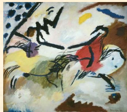
Improvisatie 20 (Twee paarden), 1911

Het werk bestaat uit twee delen, elk met vier rubrieken en versierd tussen de hoofdstukken met originele houtsneden die de schilder-schrijver er specifiek voor maakte. Verder worden in de tekst ook vier oude, religieus bezielde werken getoond ( Keizerin Theodora , Byzantijns Mozaïek uit San Vitale in Ravenna; V. en H. Dünwegge: De Kruisiging ; A. Dürer: De Kruisafname en Rafaël: De Heilige Familie uit het huis Canigiani , alle drie uit de Alte Pinakothek in München. Daarnaast ook Paul Cézanne: Badende Vrouwen , Bernheim –Jeune Parijs) en nog drie eigen werken.