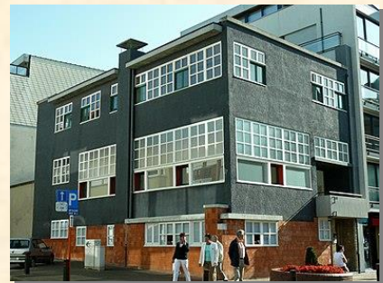
Huib Hoste Het Zwarte Huis, Knokke 1924

De Brusselse avant-garde is minder gekend in Vlaanderen. Heeft de huidige zwakke kennis van de tweede landstaal hier iets mee te maken? Wie zal het zeggen.